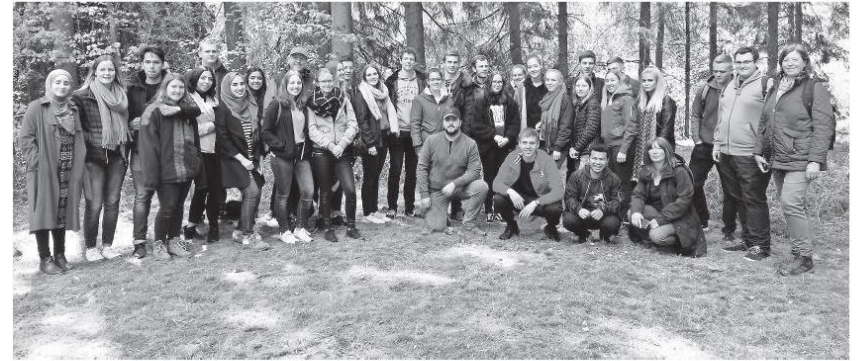
Schüler der Fachoberschule Wirtschaft und des beruflichen Gymnasiums Wirtschaft der Berufsbildenden Schulen II stellten beim Waldtag dem Rüstler Forst einen Besuch ab.