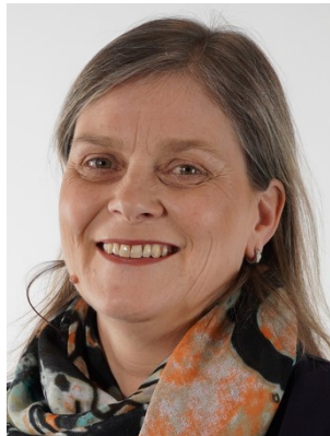
Frau Brauns Koordinatorin (Berufsschule, Partnerschulen u.a.)